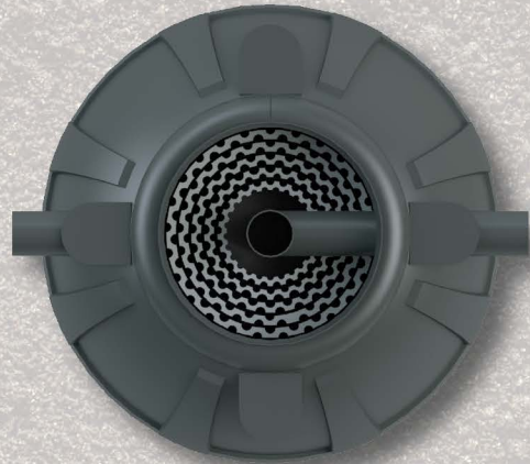
โครงสร้างถังแข็งแรงอายุการใช้งานยาวนาน ออกแบบโดยวิศวกรผู้เชี่ยวชาญ