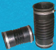
ท่อเฟล็กซ์