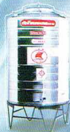
ก้นเรียบ