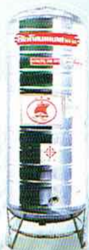
ก้นบุนสูง