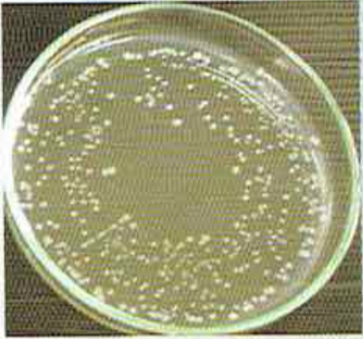
วัสดุถังทั่วไป

ผลการทดสอบการยับยั้งแบคทีเรีย โดยห้องปฏิบัติการกลุ่มวิจัยการผลิตและชิ้นรูปพอลิเมอร์ คณะพลังงานสิ่งแวดล้อมและวัสดุ มหาวิทยาลัยเทคโนโลยีพระจอมเกล้าธนบุรี