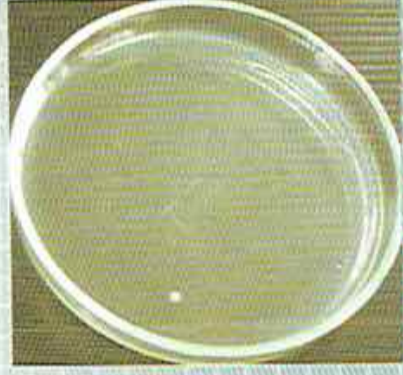
วัสดุถังJRM

ผลการทดสอบประสิทธิภาพการยับยั้งเชื้อแบคทีเรีย การลดลงของเชื้อหรือความสามารถในการกำจัดเชื้อ ของวัสดุถังJRMถึง 99.9% เมื่อเทียบกับถังทั่วไป