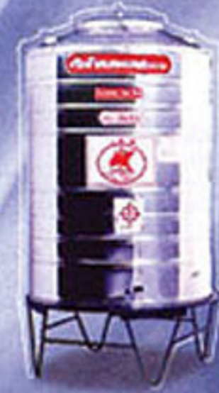
ก้นเรียบ