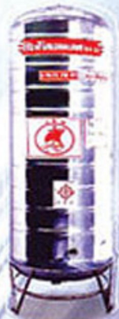
ก้นแบนสูง